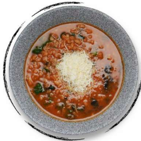
• ՎԱՆ ԱՊՈՒՐ (ՔՅԱԼԱԳՅՈՇ) AMD 2500