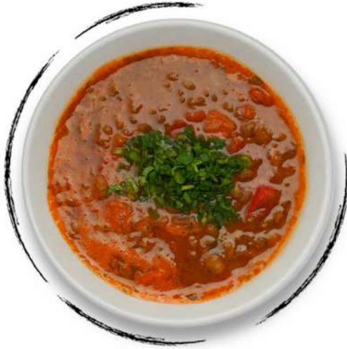
• ՈՍՊՈՎ ԵՎ ԲԱՆՋԱՐԵՂԵՆՈՎ ՃԱՇ AMD 3000