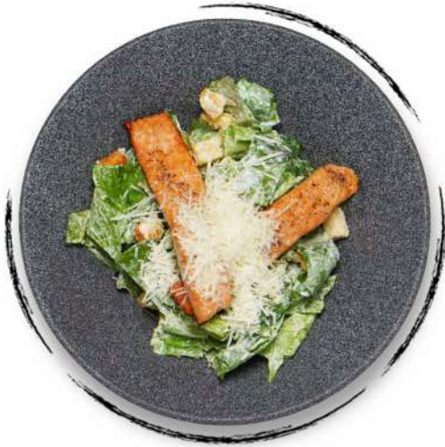
ԿԵՍԱՐ ԻՇԽԱՆԻ ՓԱՓԿԱՄՍՈՎ