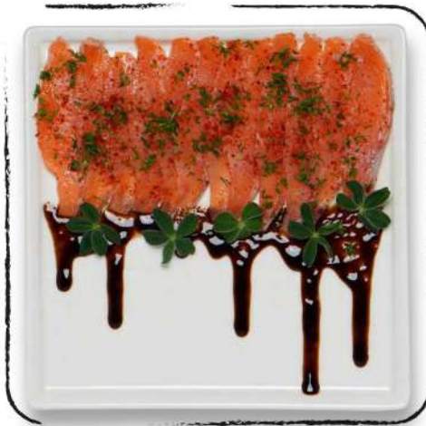
ՀԱՅԿԱԿԱՆ ՍԱՇԻՄԻ AMD 3500