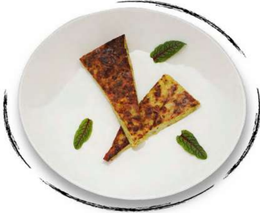
• ԴԴՄԻԿԻ ԿՈՏԼԵՏՆԵՐ AMD 2300