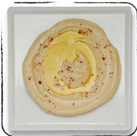
• ՀՈՒՄՈՒՍ AMD 2500