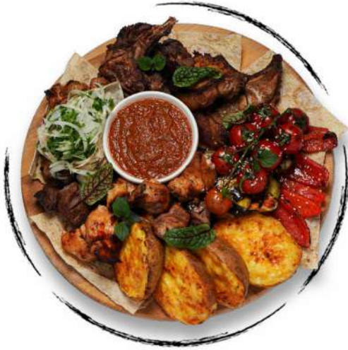
ԽՈՐՈՎԱԾԻ ՏԵՍԱԿԱՆԻ (6 ԱՆՁԻ ՇԱՄԱՐ)