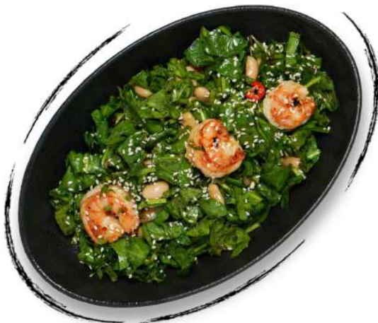
«ԱԴԱՆԱ» ԾՈՎԱԽԵՑԳԵՏՆՈՎ ԱՂՑԱՆ